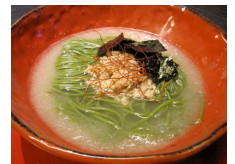
“スーパー野菜 スピルリナ”を練り込んだ緑色の麺

また、2011年に開発した「あぶらそば」は、スープがない「汁なしラーメン」。麺をあえている「あぶら」には仕掛けがあり、あぶらにカルシウムを加えることで生まれる「第6番目の旨味」と呼ばれる新しい味覚の追究と、カラダに良いあぶらの提唱に挑戦します。