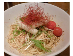
スープがなく、かき油や白ごま油で麺をあえる「あぶらそば」