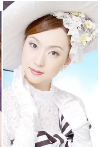
変身前(20代) → 「ワイルド&セクシー」 → 「セレブリティ」