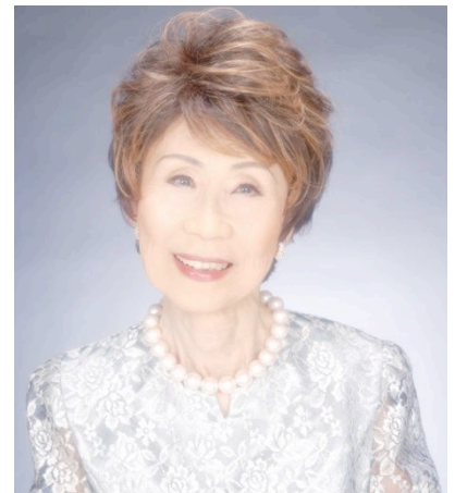
「メイク前(85歳)」 → 「メイク後」