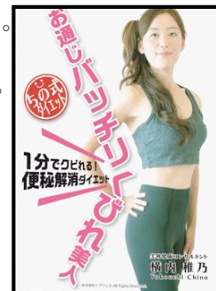
“アメブロの女王”ちの式超簡単ダイエットDVD 「お通じばっちりくびれ美人」3,980円